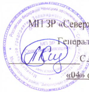
График сбора твердых коммунальных отходов в СП «Великовисочный сельсовет» д. Щелино